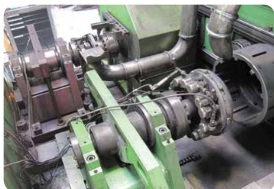
Vue des deux postes de freinage instrumentés : compétition (Formule 1) et aéronautique

Deux types de régulation sont alors mobilisés : une régulation sur le PC de commande pour la climatisation et une régulation embarquée sur FPGA (intégré dans le châssis RIO MXI-Express) pour les paramètres critiques à évolution rapide (rampes de vitesse, pression, couple).