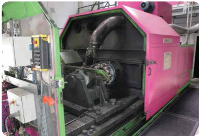
Le banc de freinage DAISY permet de tester des freins aéronautiques et automobiles.

Le banc de freinage « DAISY » est en service à MESSIER-BUGATTI-DOWTY Villeurbanne depuis 1996. Il permet de tester des freins aéronautiques et automobiles dans différentes situations et de ressortir les caractéristiques du frein testé via un rapport.