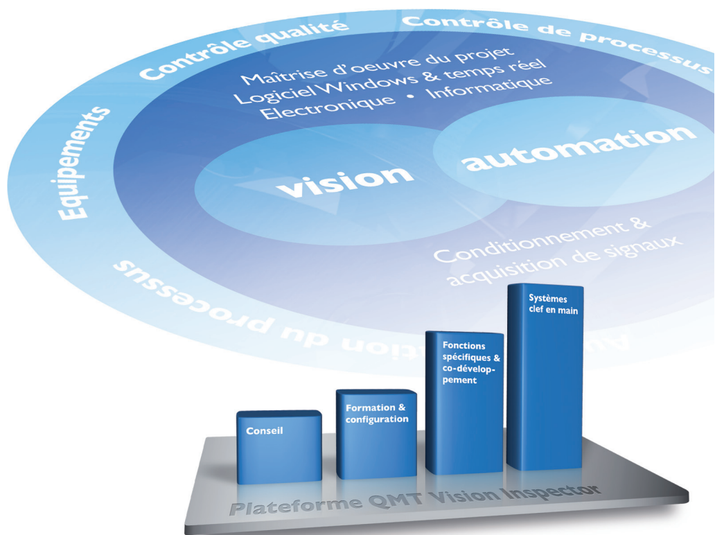
Notre plateforme QMT Vision Inspector