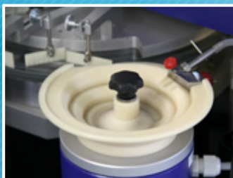
Alimentation des pièces par bol vibrant