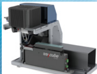
Alimentation des pièces par l'Asyfeed Pocket (option)