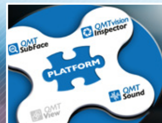
Produit issu de la plateforme QMT

La machine QMTInspect-RM s'intègre dans la gamme de machines de tri QMTInspect pour les applications de contrôle et tri à 100% de pièces de petites dimensions. Elle reprend le concept à succès de la QMTInspect-R mais en tenant compte des spécificités des besoins des industries microtechniques et