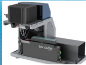
Alimentation des pièces par l'Asyfeed Pocket (option)