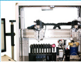
Transport des pièces par manipulateur linéaire